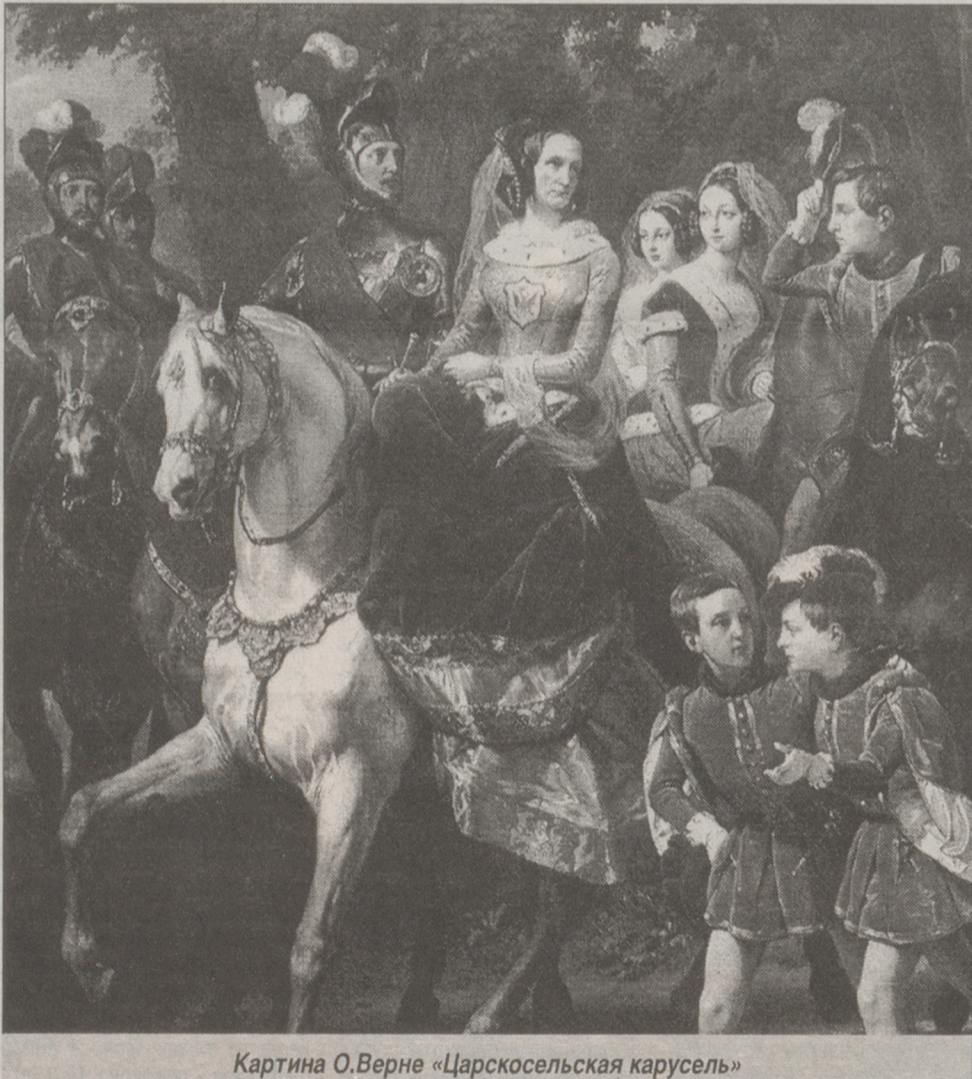
Картина О.Верне «Царскосельская карусель»

для императрицы и наследника престола, великого князя Павла Петровича, которому тогда еще не было 10 лет. Карусель состояла из 4-х кадрилей (команд): славянской, римской, индийской и турецкой. Участники были одеты в красочные старинные костюмы соответствующего народа. В состязаниях участвовали не только мужчины, но и женщины, сидящие в колесницах вместе с возницей. Дамы метали копы, пики, кольца. Судьями и распорядителями были представители знатных дворянских родов. Командовал славянской кадрилей граф И.П.Салтыков, римской - Григорий Орлов, турецкой - его брат Алексей Орлов, индийской - князь Н.И.Репнин. Главным судьей был фельдмаршал Миних.