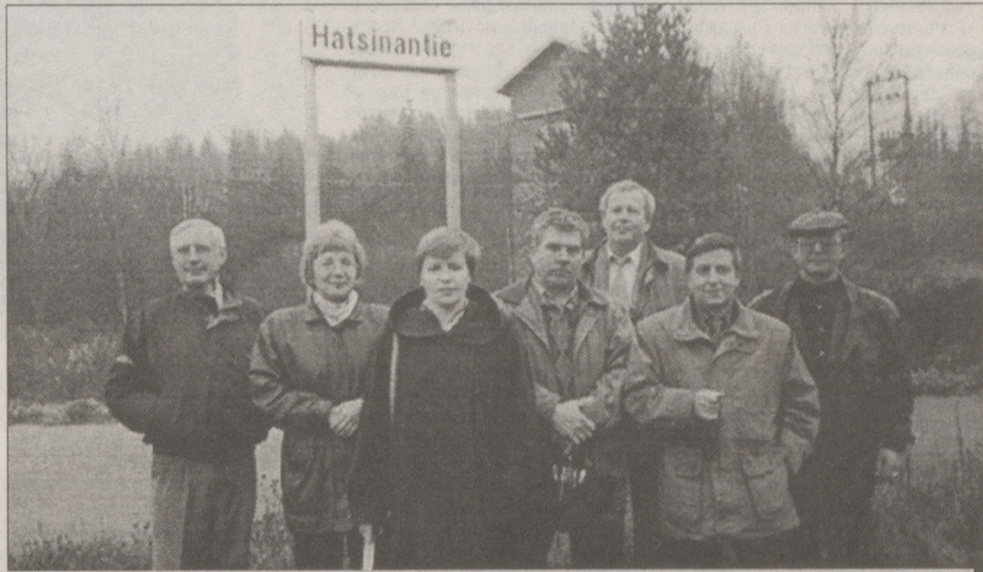
В финской Гатчине

Тем не менее, финны неустанно ищут инвесторов для закрытия свалок. На семинаре они нам сказали, что интерес к такому вложению денег проявили французские